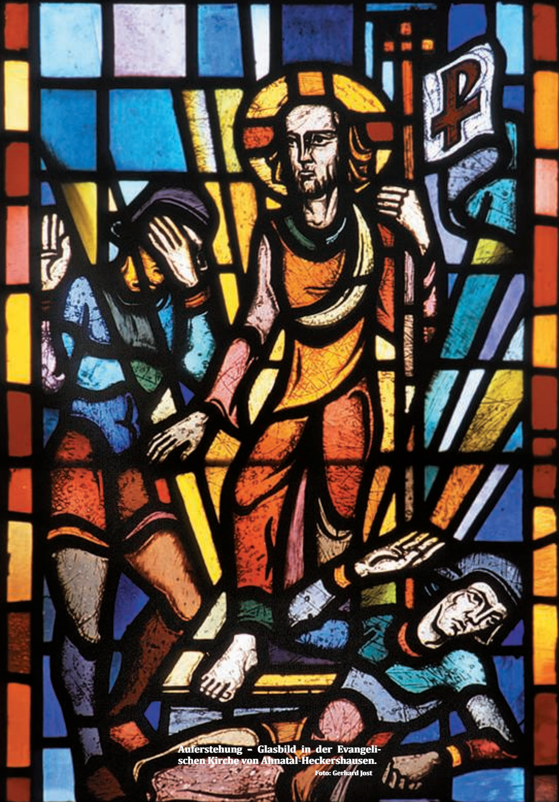
Auferstehung - Glasbild in der Evangelischen Kirche von Ahnatal-Heckershausen.