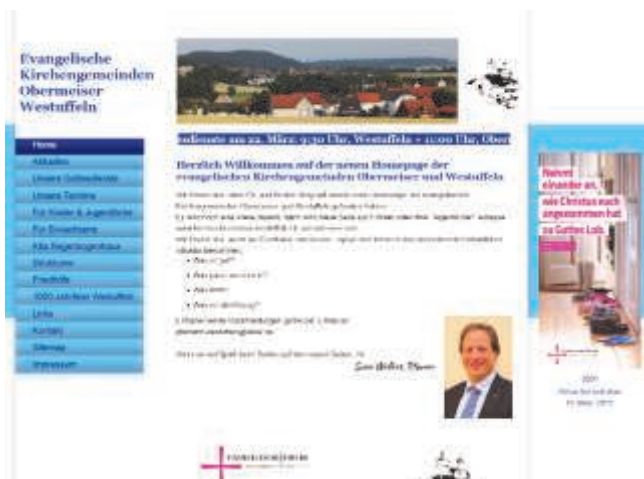
Neue Technik und neues Layout: Die neue Seite www.kirche-obermeiser-westuffeln.de unmittelbar nach der Freischaltung für den Regelbetrieb am 19. März.