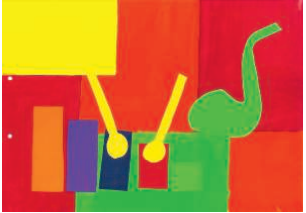
Kleine Meisterwerke: Zwei der Bilder, die Kinder unserer Kita Regenbogenhaus nach Vorlagen großer Meister geschaffen haben. Die Ausstellung aller Werke ist am 17. Juli ab 15:00 Uhr in der Turnhalle des TV Westuffeln.

Das in Nordhessen auch die Kunst ein Zuhause hat, weiß man seit Jahrzehnten durch die documenta. Seit den Sommerferien beschäftigen sich nun Kinder unserer Kindertagesstätte Regenbogenhaus mit den Großen der bildenden Kunst. Jeden Donnerstagnachmittag lernen sie einen Künstler und eines seiner Werke kennen und tauchen in dessen Welt ein. Sie beschäftigen sich mit Malern wie Pablo Picasso, Peter Paul Rubens