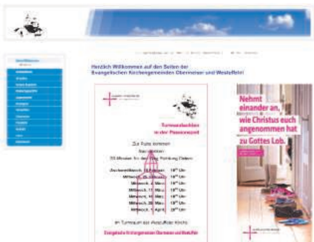
So sah die Willkommen-Seite der alten Homepage aus. Probleme machte insbesondere die auf der Flash-Player-Technik basierende Navigation der Seite.

Technisch fällt vor allem ins Gewicht, dass die Nutzung des FlashPlayers nicht mehr für die Navigation auf der Seite erforderlich ist. Dies erleichtert insbesondere die Nutzung der Seite auf Smartphones bzw. ermöglicht sie überhaupt erst. Einige Inhalte bleiben freilich weiterhin auf diese Technik angewiesen. Auf der Seite „Unsere Termine“ werden nun abgelaufene Termine automatisch aus der Seite entfernt.